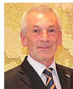
ゲオルギ・ヴァシレフ大使