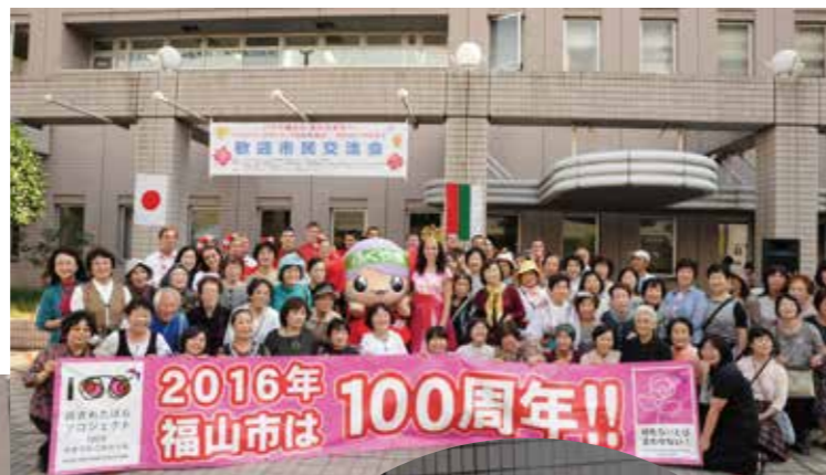
市民交流会 / 福山市役所北広場

昨年に続いてブルガリアフェスティバル福山誘致実行委員会とNPO法人福山ブルガリア協会共催の第2回福山ブルガリアフェスティバルが2015年9月29日(火)、30日(水)の2日間、ブルガリアのカザンラック民族舞踊団と2015年度バラの女王を招いて開催されました。29日は、福山市役所での市民交流会と広島県民文化センターふくやまでの公演を行い、翌30日は福山市立千年小学校で児童らと国際親善交流を行いました。