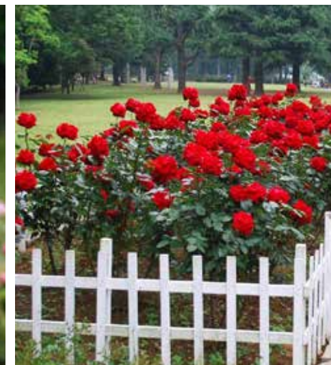
四季咲きバラ「ナデジダ(希望)」