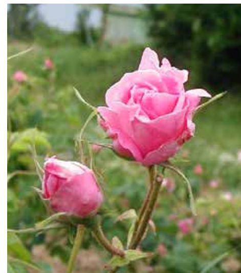
香りのバラ「ダマスクローズ」