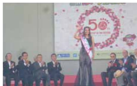
オープニングセレモニー 5/20