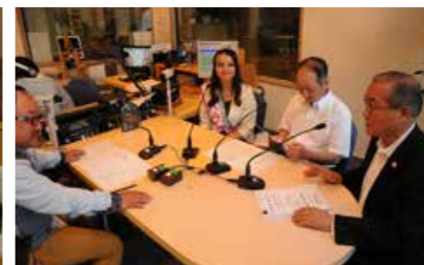
エフエム福山出演 5/18