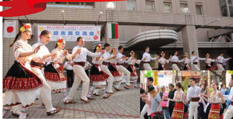
福山市役所北広場での市民交流会