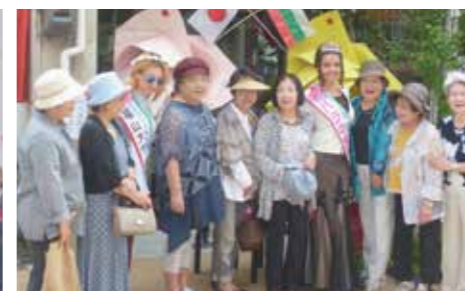
船町商店街で交流 5/21