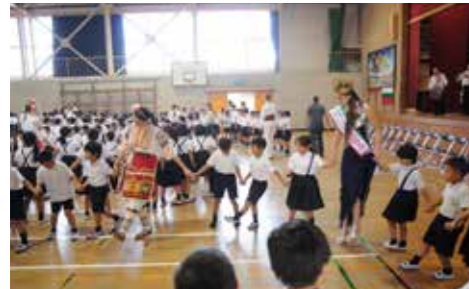
西深津小学校で親善交流