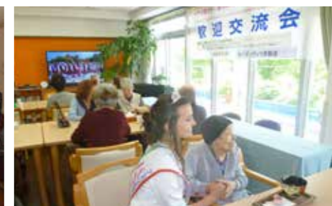
ガーデンヴィラ西新涯訪問 5/18