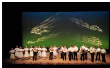
県民文化センターでのカザンラク民俗舞踊団ふくやま公演