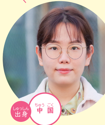
しゅっしん 出身 中国