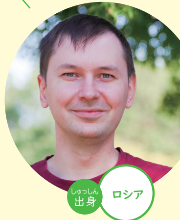
しゅっしん 出身 ロシア