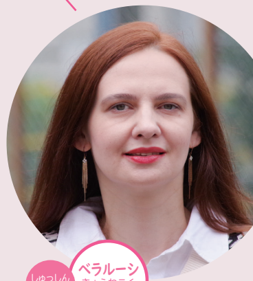
ベラルーシ共和国出身