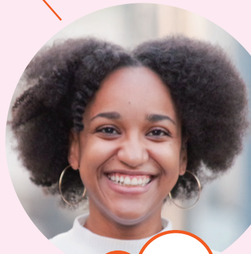
しゅっしん 出身 ジャマイカ