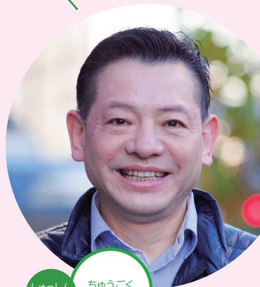
しゅっしん 出身 中国