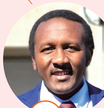
しゅっしん 出身 ケニア