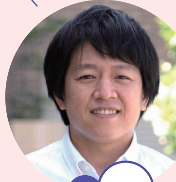
しゅっしん 出身 タイ

がいにしょくぶん か タイは外食文化 しょくじ 食事しながら はな たくさん話します